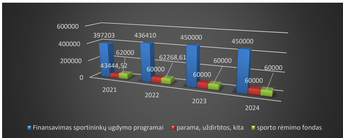
2 diagrama. VšĮ KIC 2021–2024 m. biudžeto dinamika, Eur

VšĮ KIC pagrindinis finansavimo šaltinis – Klaipėdos m. savivaldybės administracijos dalinis finansavimas pagal sportinio ugdymo programą. 2021 m. KIC suteikė sportinio ugdymo paslaugas tarifikuotiems akademinio irklavimo ir baidarių - kanojų irklavimo sportininkams. Klaipėdos miesto savivaldybės administracija pagal sportininkų programą suteikė dalinį finansavimą 397203 Eur, 105444,52 Eur įstaiga gavo iš kitų šaltinių. (žr. 2 diagramą).